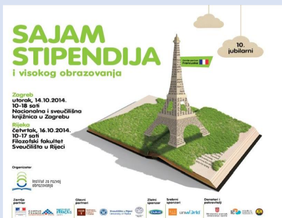
Sajam stipendija i visokog obrazovanja 14. i 16. 10. 2014.