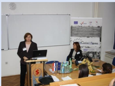
Izlaganja u paralelnim sekcijama (04. prosinca 2014.)

Sudeći po povratnim informacijama i velikom zadovoljstvu sudionika konferencije, ova izuzetno zanimljiva konferencija bila je od velike koristi sudionicima budući je obrađen veliki broj tema vezan uz implementaciju Hrvatskog kvalifikacijskog okvira u sustav visokog obrazovanja i studij strojarstva, a dobroj atmosferi na konferenciji pridonijeli su veliki trud domaćina i neformalni dijelovi konferencije, domjenak, gala večera i izlet.