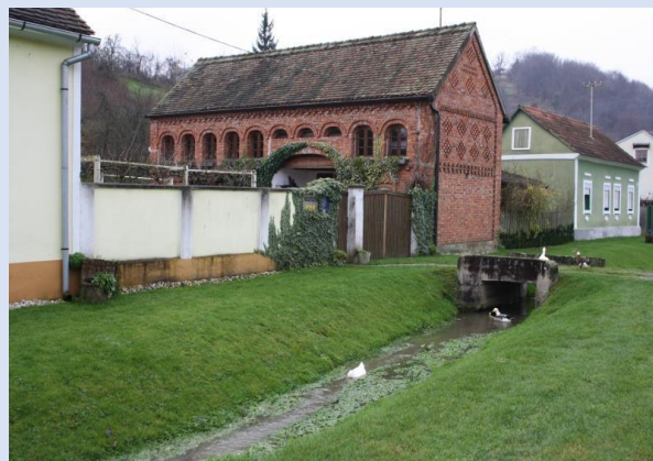
Detalj iz posjeta etno selu Stara Kapela