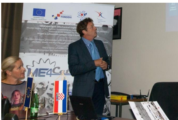
Četvrti projektni seminar na Tehničkom fakultetu Sveučilišta Rijeci, 25.- 26. rujna 2014.