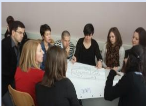
Rijeka, 28.03.2014., projekt E-quality

Institut za razvoj obrazovanja na temelju svojih kompetencija i iskustava u području javnih politika, osim doprinosa njihovim razvojima na javnoj razini, uspješno se prijavljuje i upravlja sa velikim projektima financiranim kroz programe Europske komisije. Dodatno, budući da posjeduje iskustvo pružanja savjetodavnih usluga i ekspertize, te uspješnog vođenja kompleksnih projekata (projekt menadžment), često je partner ili asistent pri vođenju projekata drugih partnera.