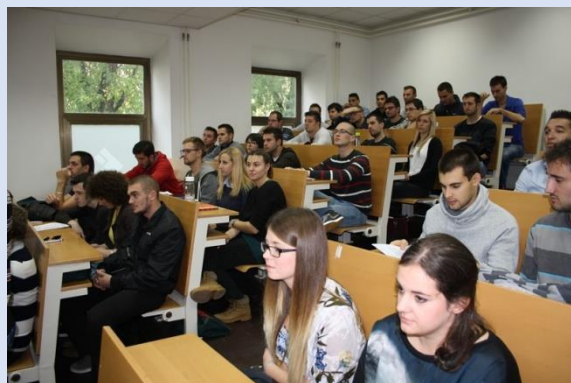
Dvodnevni studentski seminar u Slavonskom Brodu (30.- 31. listopada 2014.)