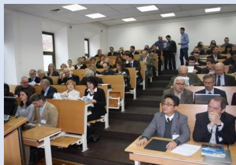
Plenarna predavanja na konferenciji (04. prosinca 2014.)