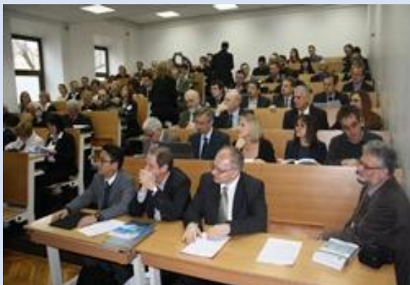
Otvaranje Međunarodne stručne konferencije ME4CataLOgue

Cilj ove konferencije je bio promovirati reformu visokog obrazovanja odnosno implementaciju Hrvatskog kvalifikacijskog okvira u sustav visokog obrazovanja, posebice u studijima strojarstva te informirati javnost o ME4CataLOgue projektu i njegovim ishodima. Konferencija je okupila veliki broj relevantnih i zainteresiranih dionika za navedeno područje, domaće i strane stručnjake, nastavnike, predstavnike institucija visokog obrazovanja, agencija, ministarstva, poduzeća, ali i poslodavce, studente i ostale dionike. Uz mnoge zanimljive radova na zadanu temu, na konferenciji su otvorena nova pitanja, te je ona tako poslužila i kao platforma za razmjenu znanja, ideja i primjera dobre prakse.