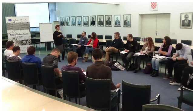
3. studentska radionica na Fakultetu strojarstva i brodogradnje u Zagrebu, 23. i 24. 10. 2014.

Svrha radionice je unaprjeđivanje vještina upravljanja karijerom sudionika koje podrazumijeva stjecanje znanja i vještina potrebnih za povećanje zapošljivosti i unapređenje profesionalnog razvoja, odnosno razvoja karijere za bolju konkurentnost na tržištu rada. Radionica se temelji na participativnim i iskustvenim metodama rada koje uključuju vježbe, igranje uloga (rad s kolegama), individualni i grupni rad, diskusija, primjena testova i analiza rezultata uz odgovarajuću diskusiju, i razmjena znanja i iskustva.