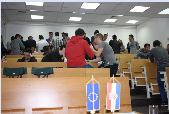
Rad studenata u grupama u sklopu seminara u Slavenskom Brodu (30.- 31. listopada 2014.)

„Od ideje do financiranja” naslov je trećeg predavanja, koje je obilježio grupni rad. Na njemu su studenti u formi grupnog rada razvijali vlastite ideje, poslovne planove i marketinške strategije, te osnove financiranja potrebne za plasman ideje na tržište i razvoj poslovanja.