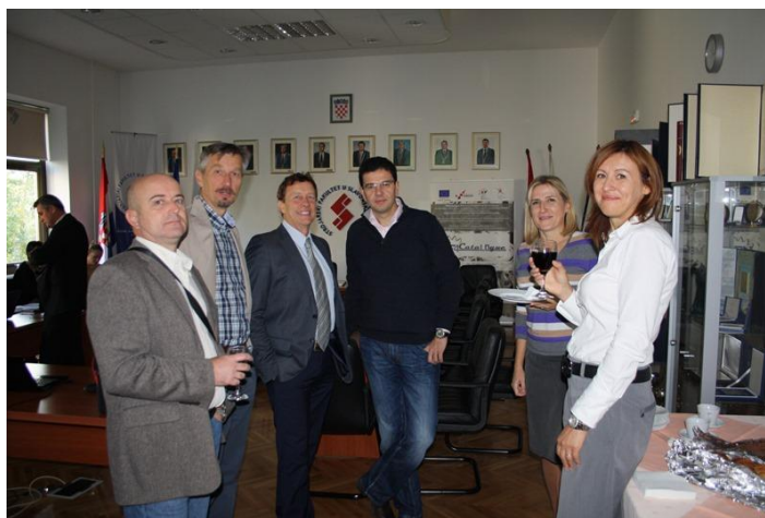
Peti sastanak projektnog tima ME4CataLOgue na Strojarskom fakultetu

Bilo je riječi o predstavljanju projekta na 8. LLL tjednu, 7. Sajmu poslova u Slavonskom Brodu (24.10.2014.), Danu Tehničkog fakulteta u Rijeci (7.11.2014.) te 4. međunarodnom kongresu Dani inženjera strojarstva u Vodicama (25.-27.3.2015.).