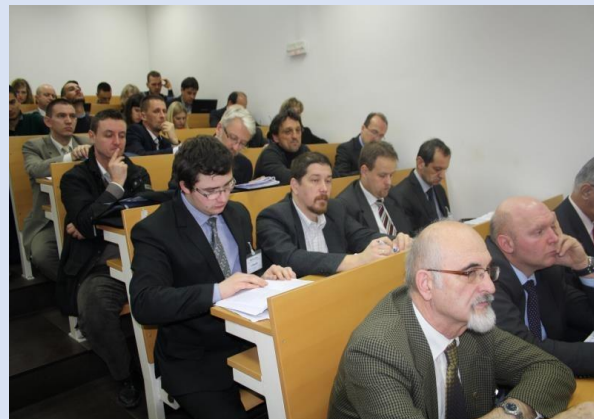
Međunarodna stručna konferencija u Slavenskom Brodu (03. do 05. prosinca. 2014.)