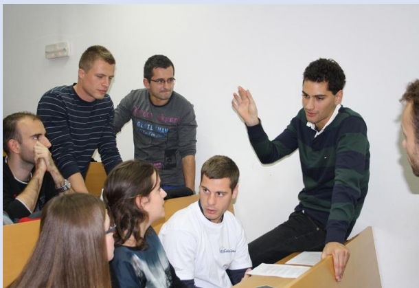
Rad u grupama u sklopu Studentskog seminara u Slavonskom Brodu (30.- 31. listopada 2014.)

Nakon dva inspirativna predavanja i debate, na kojima su studenti dobili doista vitalne i korisne informacije, na redu je bio rad u grupama. Na temelju uvida dobivenih na predavanjima, studenti su u grupama radili vježbe vezane uz plasiranje inovacija i poslovanje tvrtke: odabir inovativnog proizvoda, izrada dijagrama toka proizvoda, planiranje svih daljnjih koraka, identifikaciji glavnih trendova na tržištu i industriji, kupaca, tržišta; dobavljača, potrebna sredstva, financije, izvori energije, izradi poslovnog plana, vizije poslovanja. Prvi dan seminara završio je okruglim stolom, na kojem su uz studente s četiri fakulteta i predavače, sudionici bili predstavnici tvrtki Đuro Đaković Holding, Bilfinger Đuro Đaković Montaža, Đuro Đaković TEP, Sigmat i CTR.