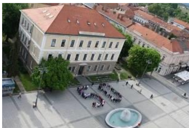
Strojarski fakultet u Slavenskom Brodu

Nositelj projekta je Strojarski fakultet u Slavenskom Brodu, a partneri na projektu su Fakultet strojarstva i brodogradnje u Zagrebu, Fakultet elektrotehnike, strojarstva i brodogradnje u Splitu, Tehnički fakultet u Rijeci i Institut za razvoj obrazovanja u Zagrebu. Kroz projekt će se ostvariti čvršća povezanost obrazovnog sektora i tržišta rada kako bi standard kvalifikacija odgovarao stvarnim potrebama tržišta rada, stoga će se u projekt uključiti i Hrvatski zavod za zapošljavanje, Hrvatska gospodarska komora, Hrvatska komora inženjera strojarstva, CTR – Razvojna agencija Brodsko-posavske županije, te studentski zborovi i udruge bivših studenata četiri partnerska fakulteta.