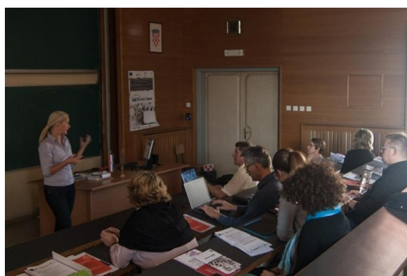
Četvrti projektni seminar na Tehničkom fakultetu Sveučilišta u Rijeci, 25.- 26. rujna 2014.

Nakon panel radionice sudionici su nastavili rad u grupama koji je bio nastavak zadatka s prethodne radionice. Fokus rada u grupama je bio na skupovima ishoda učenja za obavezne i izborne predmete studija strojarstva na diplomskoj i preddiplomskoj razini.