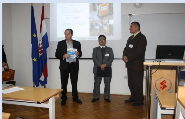
Donacija tvrtke Daihen Strojarskom fakultetu na otvaranju Konferencije

Program konferencije je započeo domjenkom dobrodošlice pristiglim sudionicima na kojem su sudionici imali priliku međusobno se upoznati i pripremiti za naredni dan. U četvrtak, 4.12.2014. godine odvijao se glavni program konferencije. Nakon plenarnih predavanja, izlagači su svoje radove predstavljali u paralelnim