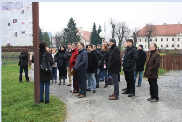
Posjet sudionika Konferencije Tvrđavi u Slavenskom Brodu