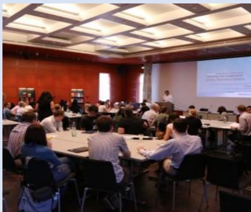
Dresden, srpanj 2013. godine, projekt ACCESS

• Tempus JEP projekt "ECAS" – Pokretanje centara za profesionalno savjetovanje na hrvatskim sveučilištima (2007.-2009), koji je nastavak projekta Tempus SCM CAREER- Platforma za centre za profesionalno savjetovanje u Hrvatskoj" (2005.-2006.). Glavni cilj Tempus JEP "ECAS" projekta je pokretanje centara za profesionalno savjetovanje studenata na 3 hrvatska sveučilišta (Sveučilište u Dubrovniku, Sveučilište u Rijeci i Sveučilište J.J. Strossmayera u Osijeku) kako bi kroz rad službi za profesionalno savjetovanje studenata ta sveučilišta postala ključni dionici u akademskoj zajednici i na tržištu rada, čime će osigurati povezivanje visokog obrazovanja i tržišta rada .