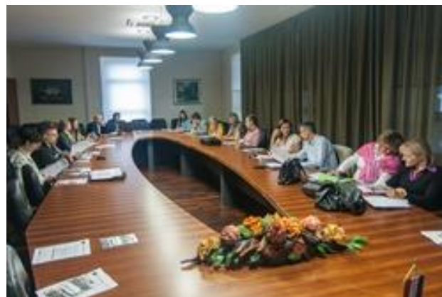
Četvrti projektni seminar na Tehničkom fakultetu Sveučilišta u Rijeci, 25.- 26. rujna 2014.