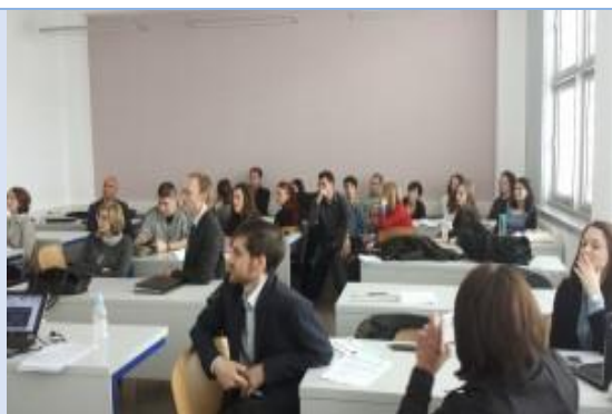
Rijeka, 28.03.2014., projekt E-quality