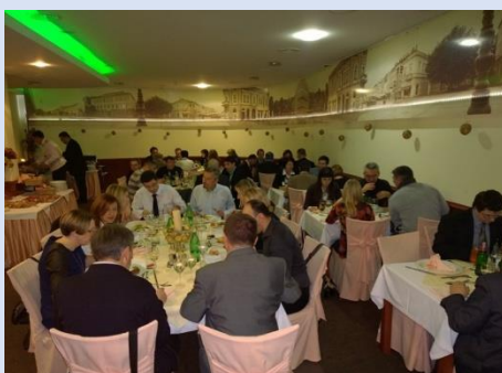
Svečana večera za sudionike Konferencije (04. prosinca 2014.)