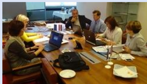
Četvrti sastanak radne skupine na Fakultetu strojarstva i brodogradnje u Zagrebu, 22. rujna 2014.

Cilj radne skupine je dati prijedlog kataloga kvalifikacija za struku strojarstva koja će uključivati i preporuke za doktorsku razinu studija. Četvrti sastanak radne skupine održan je na Fakultetu strojarstva i brodogradnje u Zagrebu, 22. rujna 2014. godine. Peti sastanak radne skupine održan je na Fakultetu strojarstva i brodogradnje u Zagrebu, 10. listopada 2014. godine.