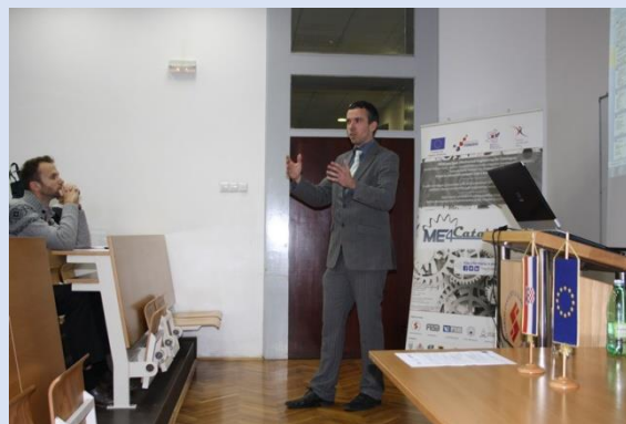
Dvodnevni studentski seminar u Slavonskom Brodu (30.- 31. listopada 2014.)

Prvo predavanje dr. Petra Procházke s Ekonomskog fakulteta u Pragu odnosilo se na uvođenje u poduzetništvo. Predavanje je bilo usmjereno razumijevanju poduzetništva, njegovog procesa, koristi, ali i rizika i prepreka, poslovnih struktura te poslovanju u globalnom kontekstu. Drugo predavanje pobliže je pojasnilo izradu i tajne uspješnih poslovnih planova, te inovacija, odnosno definirani su elementi poslovnog plana, uloga inovacija u poslovanju i zaštita inovacija.