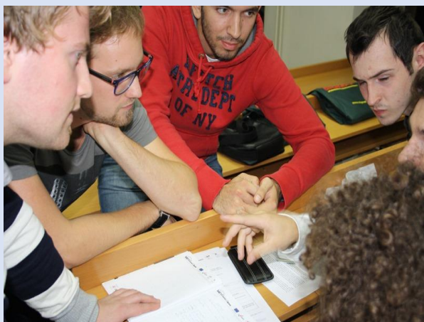
Razrada poslovnih ideja studenata u okviru seminara (30.- 31. listopada 2014.)