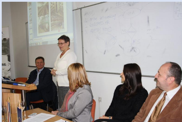
Okrugli stol s poslodavcima u sklopu Studentskog seminara (30.- 31. listopada 2014.)