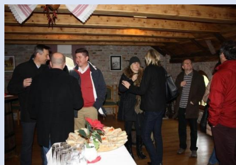
Izlet etno selu Stara Kapela u sklopu Konferencije (05. prosinca 2014.)