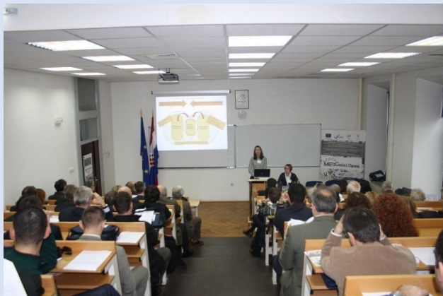
Međunarodna stručna konferencija u Slavenskom Brodu - rad u paralelnim sekcijama -

Više o samom programu međunarodne stručne konferencija ME4CataLOgue konferencije, te o izloženim radovima može saznati na internet stranici ME4CataLOgue projekta, odnosno na poveznici: http://me4catalogue.sfsb.hr/dogadjanja/medunarodna_strucna_konferencija/medunarodna_strucna_konferencija_03-05_12_2014.aspx gdje također možete pronaći i Zbornik objavljenih radova, i sve održane prezentacije u pdf formatu.